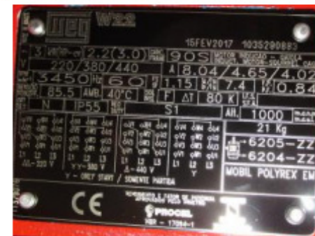
Placa de identificação do motor

Para todas as tensões utilizar botoeira de acionamento e contator de corrente superior a 10A, próprios para esse tipo de aplicação (motor).